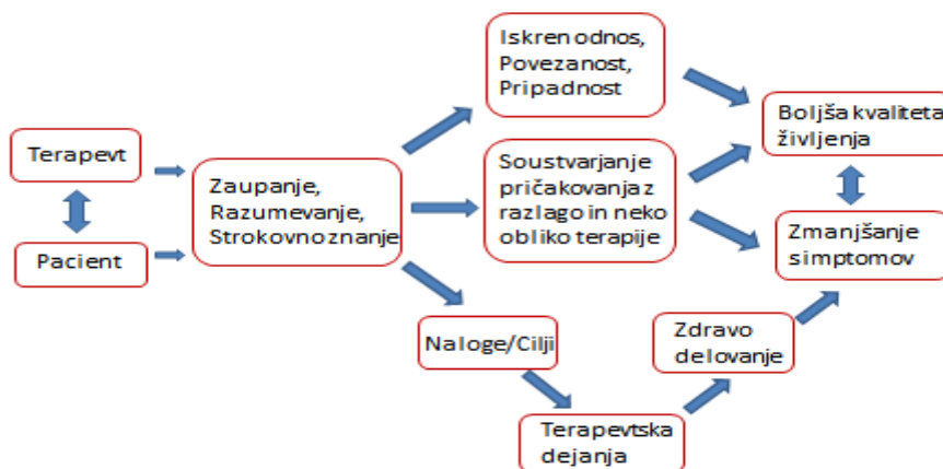
Slika 1: Kontekstualni model (Wampold in Imel, 2015: 53)

Zagovorniki kontekstualnega modela oziroma delovanja skupnih dejavnikov menijo, da psihoterapija, ki temelji na empirično podprtih povezavah med terapevtskimi metodami in diagnostičnimi kategorijami (v nadaljevanju empirično podprta psihoterapija), zanemarja tri pomembna področja: terapevtovo osebnost, psihoterapevtski odnos in klientove značilnosti, ki niso vključene v diagnozo (Norcross, 2002: 4-6) (glej sliko 2).